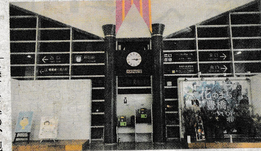
豊橋駅東西通路に設置された大時計