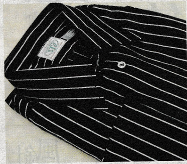
クレリック前